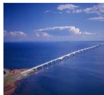
Pont de la Confédération