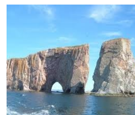
Rocher Percé Rock

Close to one hundred airings of a pro-life TV ad entitled "What If" were conducted starting February 13, 2012, on Global TV. To watch the ad: http://nbrighttolife.ca , under "Media", then "Videos".